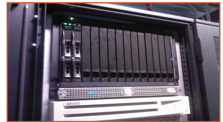
Le serveur lame, don d'IBM On demand Community, hébergé chez Pilot Systems

(*) Economic impact of open source software on technologies (ICT) in the EU—20 Nov 2006