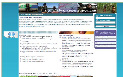
La page d'accueil du futur site pour l'apprentissage du français oral www.ancolie.pageduc.org